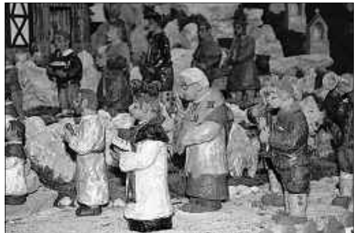
Die originelle fränkische Weihnachtskrippe in der Wallfahrtskirche Maria im Grünen Tal lädt vom 24. Dezember bis zum 2. Februar zum Besuch ein.