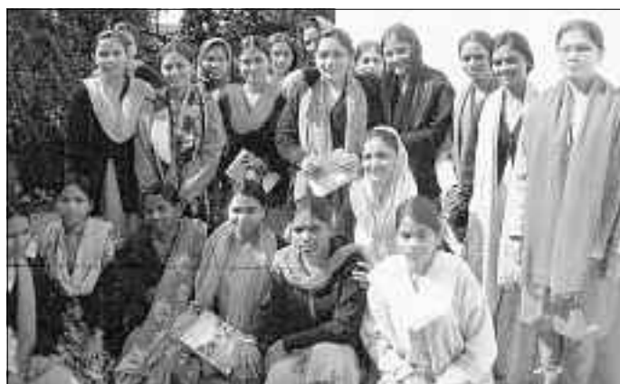
Schülerinnen der Krankenpflegeschule des Nityaseva Hospitals in Shevgaon